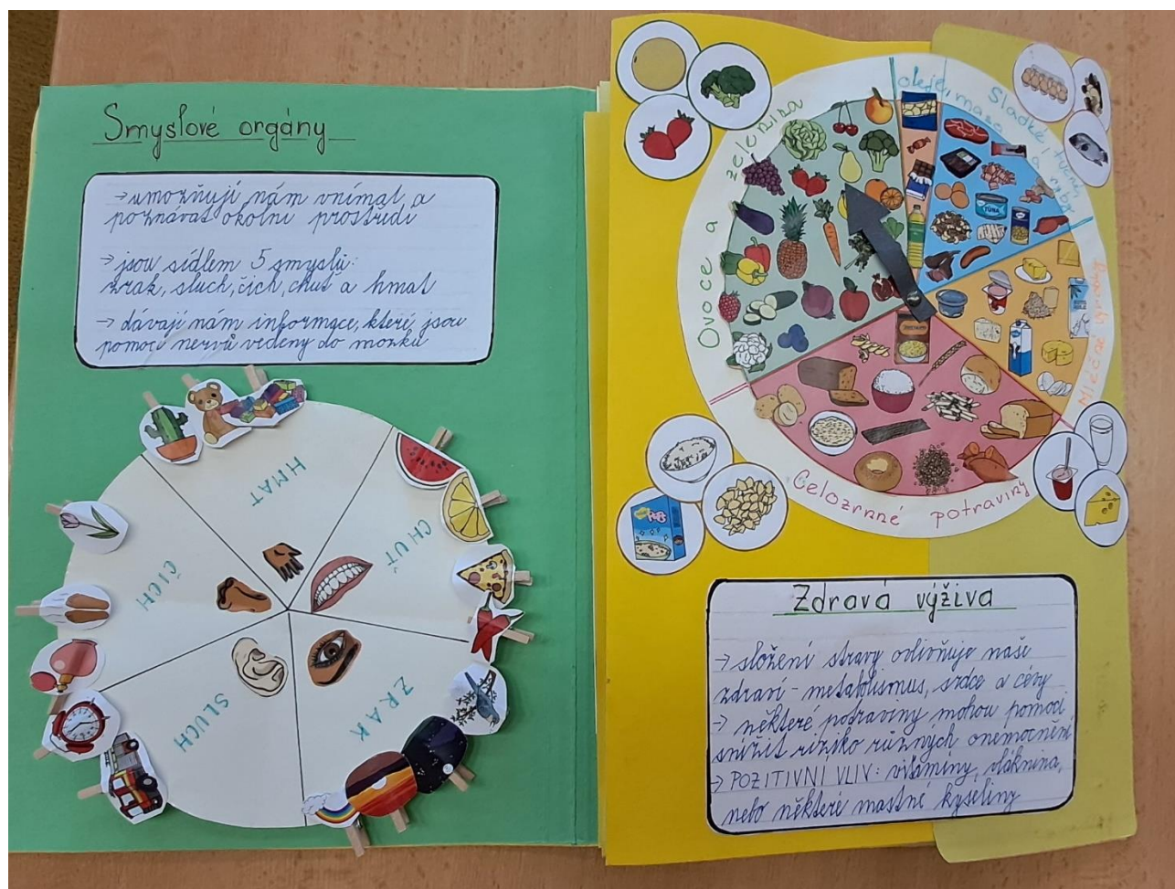
Žáci 2. A tvořili lapbooky

Ve všech ročnících základní školy byli žáci vzděláváni podle Školního vzdělávacího programu pro základní vzdělávání „Škola s širokou nabídkou“.