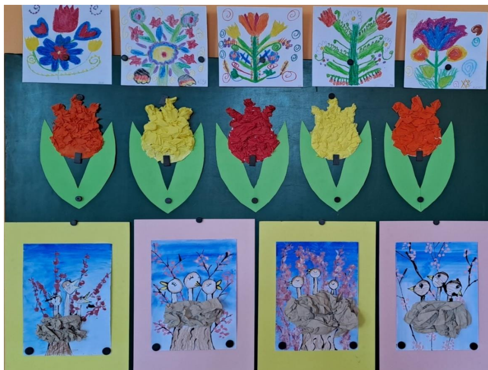
Práce žáků 2. ročníku