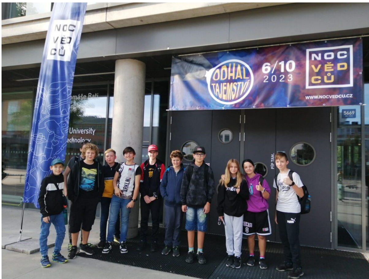
Noc vědců ve spolupráci s UTB Zlín

Ve spolupráci s UTB Zlín v rámci podpory nadání se mohla skupinka našich žáků zúčastnit Noci vědců. Dalších 40 žáků se vydalo na podzim do Technologického centra v Ostravě.