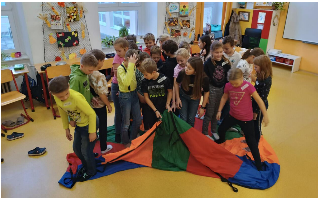
Akce „Zdravé třídní klima“ ve 4. ročnících, kde vznikly od září nové kolektivy žáků