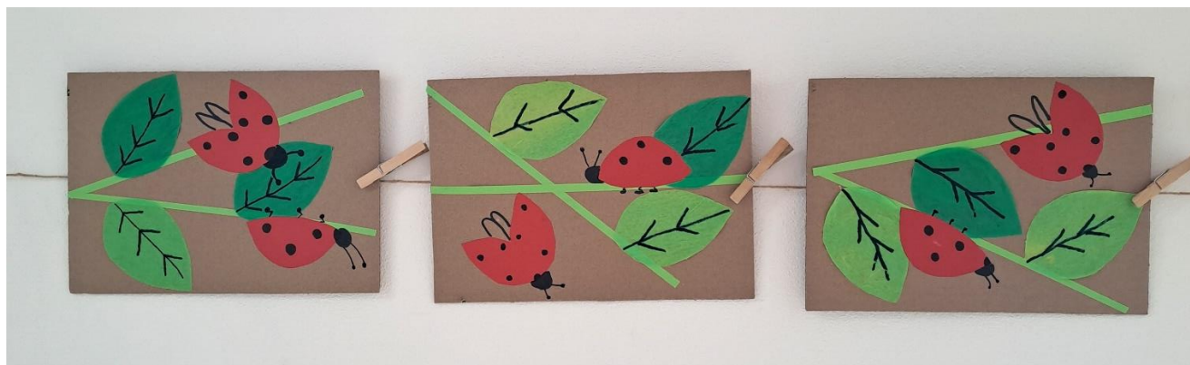
Práce žáků 2. ročníku