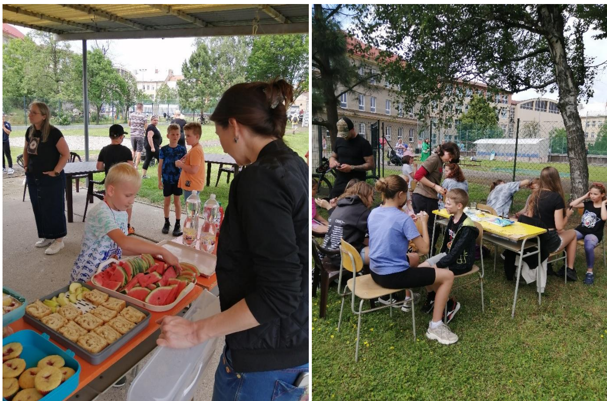
Dětský den 31. 5. 2024