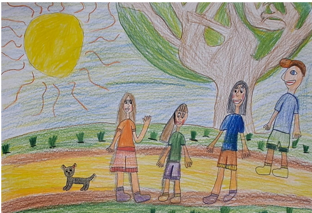
Práce žáků 2. ročníku

Všechny kroužky vedli pedagogové školy, pouze jeden vedl externí pracovník (Klub zábavné logiky a deskových her pro 1. stupeň)