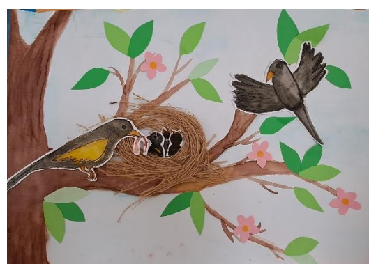
Výtvarné práce žáků 2. stupně