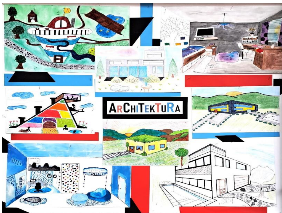
Práce žáků ve výtvarné výchově na 2. stupni.