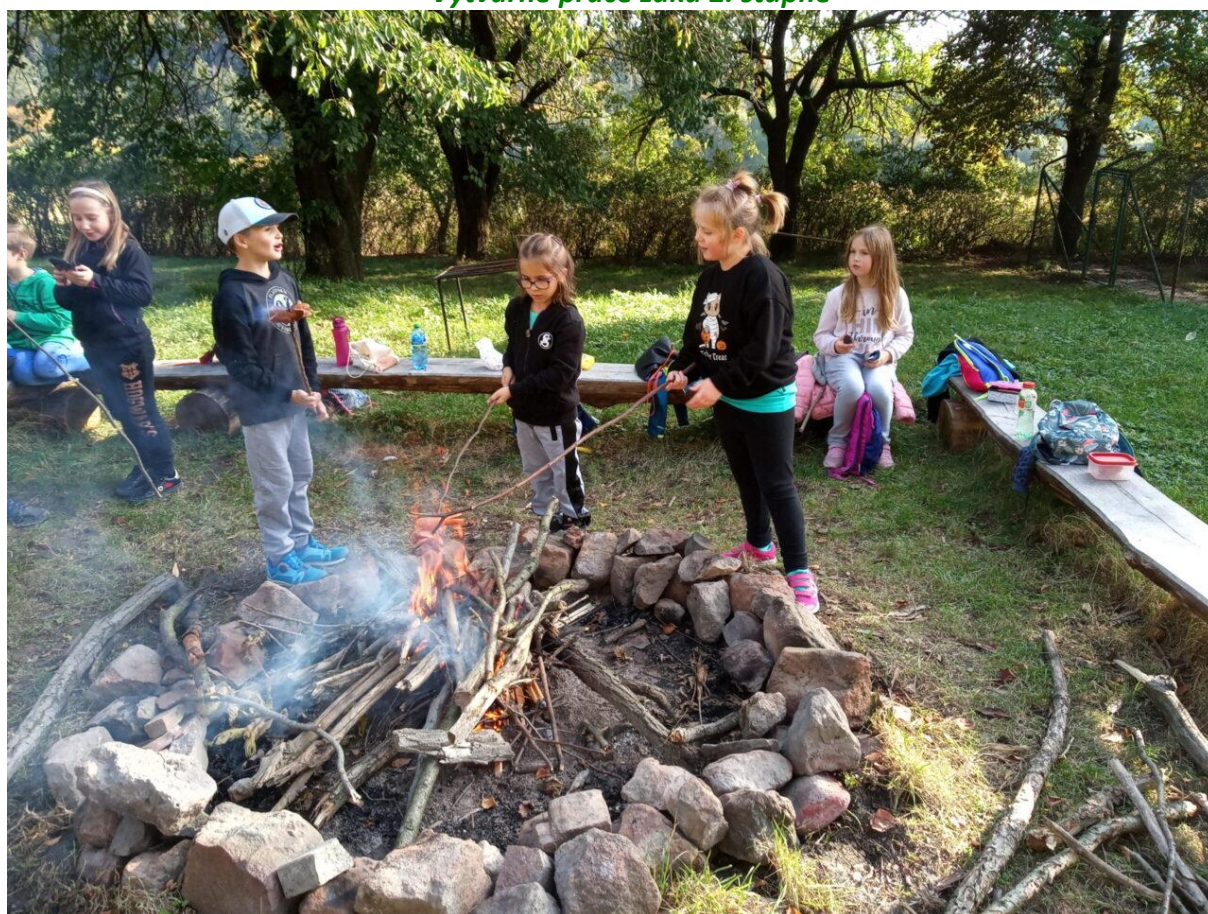
5. oddělení ŠD na podzim v přírodě